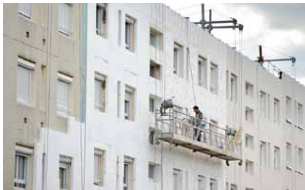
Les travaux pour l'amélioration de l'efficacité énergétique des logements peuvent donner lieu à des prêts intéressants.

Si vous percevez des allocations familiales et sous conditions de ressources, vous pouvez bénéficier de ce prêt qui concerne, entre autres, les travaux d'amélioration et d'isolation thermique . Il peut couvrir 80% de leur montant (montant plafonné). Pour plus d'informations, adressez-vous à votre caisse d'allocations familiales (CAF).