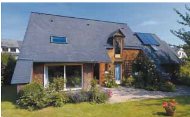
Isoler votre toit ! 25 à 30 % de la chaleur s'échappe par la toiture.