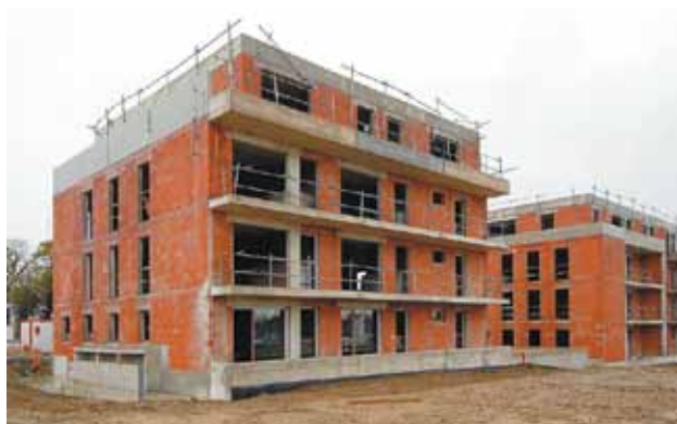
En 2014, les aides financières encouragent la construction de logements très économes en énergie.

Le prêt à taux zéro+ est réservé aux logements respectant la réglementation thermique 2012.