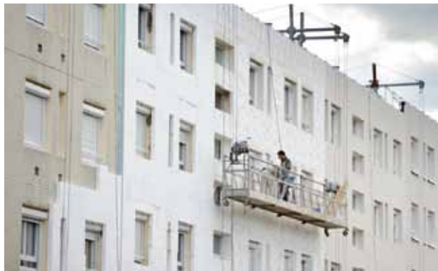
Les travaux pour l'amélioration de l'efficacité énergétique des logements peuvent donner lieu à des prêts intéressants.

Si vous percevez des allocations familiales et sous conditions de ressources, vous pouvez bénéficier de ce prêt qui concerne, entre autres, les travaux d'amélioration et d'isolation thermique . Il peut couvrir 80% de leur montant (montant plafonné). Pour plus d'informations, adressez-vous à votre caisse d'allocations familiales (CAF).